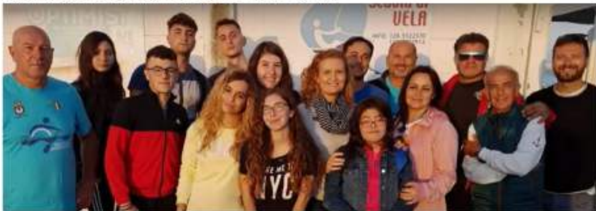
"... Il Mare una Risorsa Sportiva", il progetto orario e condotto dagli operatori del Centro Velico Gargano, presso il molo di Ponente di Manfredonia.