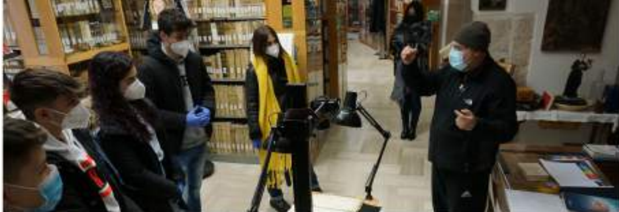
P.C.T.O. "Amasnuma digital" - Gestione del sistema documentale della biblioteca. Conoscere per far sopravvivere il nostro patrimonio culturale. Biblioteca Francescana Provinciale "P. Antonio Faria" o/o Santuario San Matteo Apostolo, San Marco in Lamis. Febbraio 2021.