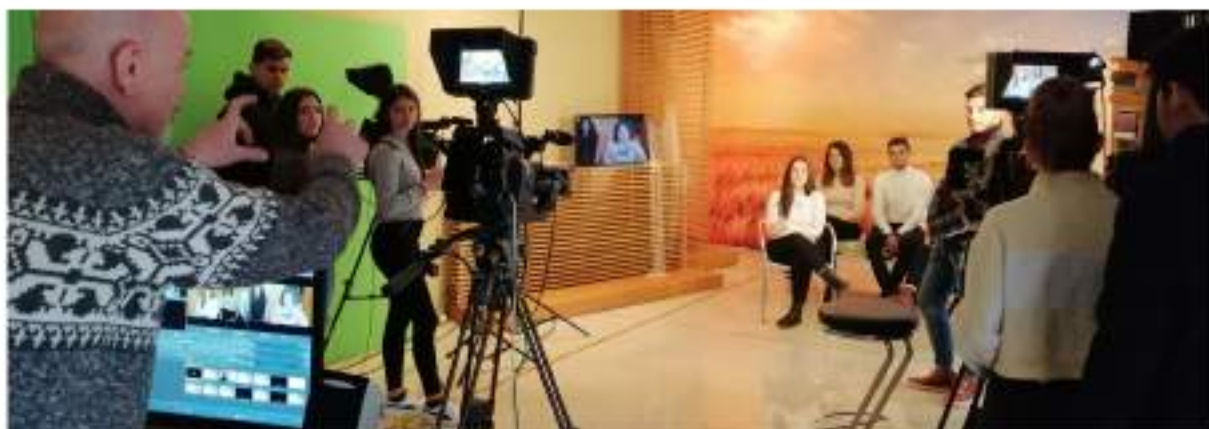
"Dire Fare Creare" (Progetto PCTO): Gli alunni raccontano la scuola nelle vesti di comunicatori, giornalisti e video maker. Presso l'emittente TV "Tela Radio Padre Pio".