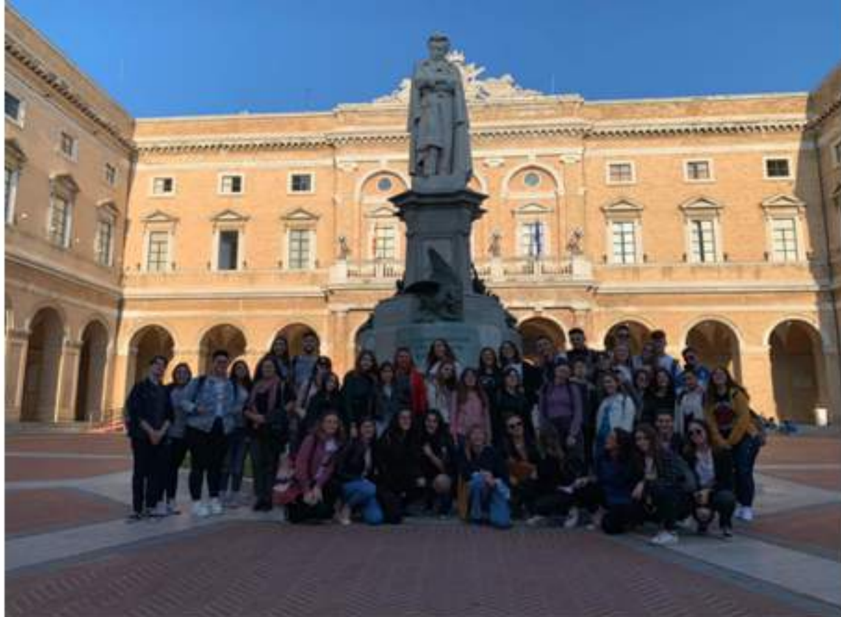
"Viaggio nella Storia e nella Cultura": viaggio di istruzione classi a Recanati