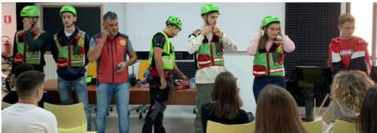
"Corso di pronto intervento e soccorso alpino". A cura degli operatori del Gruppo Speleo di San Marco in Latisna.