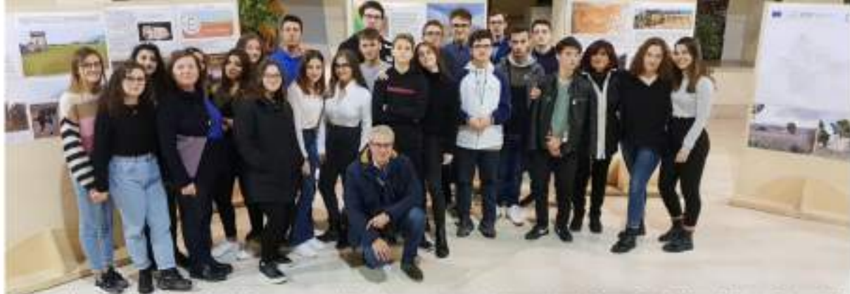
Convegno: "A scuola nella miniera di Bauxite". Presentazione pubblica delle proposte progettuali elaborate durante il Progetto Pon "EcoMuseo". Chiosso Palazzo di Città, San Giovanni Rotondo, 08.10.2020.