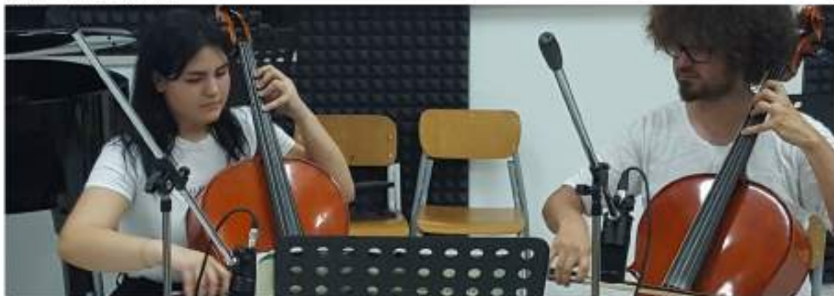
"Progetto prove aperte". A cura dei docenti di strumento del Liceo Musicale.