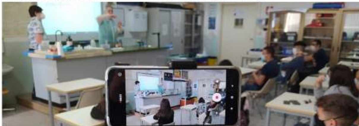
"Progetto 'INSPIRED'" - Gli studenti raccontano la scuola. Laboratorio di Scienze e Chimica, Liceo Statale "Maria Immacolata", Maggio 2021.