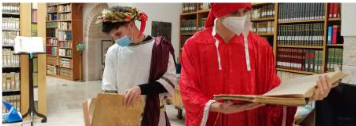
Progetto "TramontiCarite", realizzato in occasione del Dintedi (Giornata nazionale dedicata a Dante Alighieri). Biblioteca Francescana Provinciale "P. Antonio Faria" o/o Santuario San Matteo Apostolo, San Marco in Lamis. Marzo 2021.