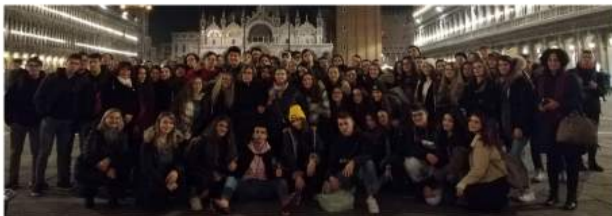
"Viaggio nella Storia e nella Cultura": viaggio di istruzione classi quarte a Recanati, Venezia e Trieste (dal 20 al 23 novembre 2016)