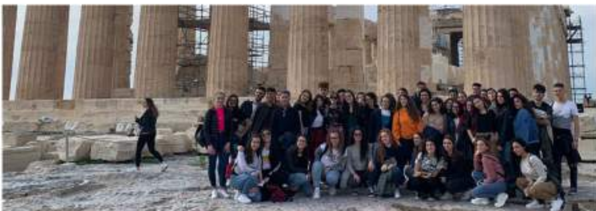
"Viaggio nella Storia e nella Cultura": viaggio di istruzione classe quinta in Grecia (dal 17 al 23 novembre 2019).