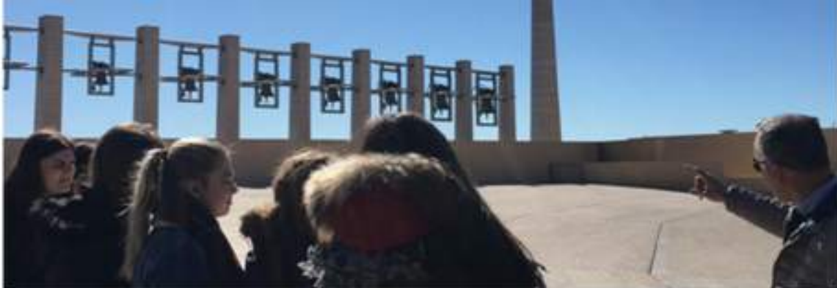
"Guide in Francese nei luoghi di San Pio da Pietraltina" (percorso di PCTO). A cura della Fondazione "Voce di Padre Pio", San Giovanni Rotondo.