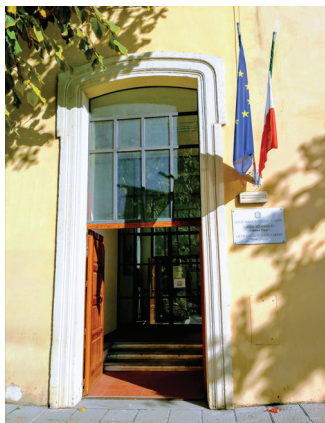
Sede Beata Angela