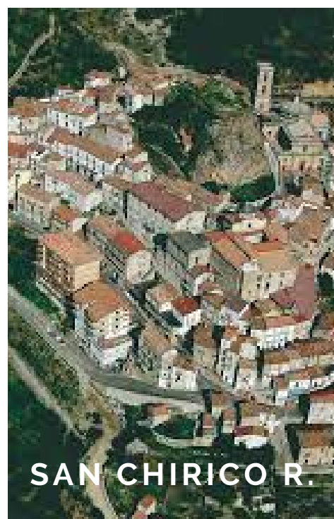
SAN CHIRICO R.