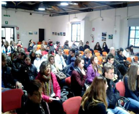
Seminario Didattica e Design presso la sede del Parco dell'Appia Antica Roma

Il dirigente scolastico è responsabile dell'organizzazione e nomina un suo staff di collaboratori; egli segue in prima persona le attività che vi si svolgono e la qualità dei rapporti umani, di cui è garante in quanto primus inter pares . Il personale docente progetta l'attività didattica e formativa, la componente amministrativa e tecnica ne fornisce il supporto strutturale, gli studenti costituiscono l'interesse primario dell'organizzazione e sono, con le famiglie, testimoni attivi e critici dell'efficacia del suo funzionamento.