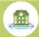
Numero studenti per indirizzo di studio e anno di corso