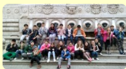
Parole in Piazza, Pon 2014-2020 Scuola primaria "C. Antognini"

"C. FAIANI" via Oberdan, 27 Ancona ANEE81603V CORSO A TEMPO PIENO 40 ore settimanali Dal lunedì al venerdì dalle 8.00 alle 16.00