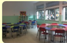
Aula 3.0 Scuola primaria "C. Antognini"