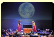
Musical "Bye Bye Scuola Media" Scuola "Donatello" a.s. 2018/2019