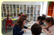
Atelier creativo Scuola primaria "C. Faiani"