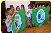
Bandiera verde Eco-Schools

"XXV APRILE" via Buonarroti, Ancona ANAA81602L TEMPO SCUOLA 40 ORE SETTIMANALI Dal lunedì al venerdì dalle 7.50 alle 15.55 Ingresso dalle 7.50 alle 9.00