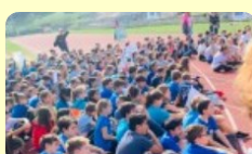
Marathon Kids – Nessuno escluso a.s. 2019/2020