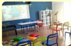
Aula 3.0 Scuola secondaria I grado "Donatello"

Ambienti e spazi di apprendimento attrezzati integrano la didattica con le risorse tecnologiche. Cuore dell'ambiente di apprendimento sono le relazioni organizzative che pongono al centro gli studenti, il loro impegno attivo e cooperativo e i docenti, capaci di sintonizzarsi sulle motivazioni degli studenti.