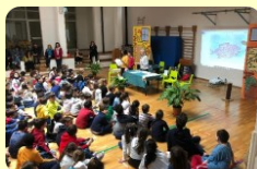
Premiazione Concorso letterario di Istituto a.s. 2018/2019