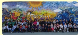
Io decoro Ancona e tu? Scuola primaria "C. Faiani" Premio obiettivo raggiunto a.s. 2018/2019