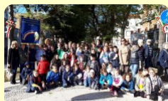
Giornata dell'Unità d'Italia e delle Forze Armate 4 novembre 2019