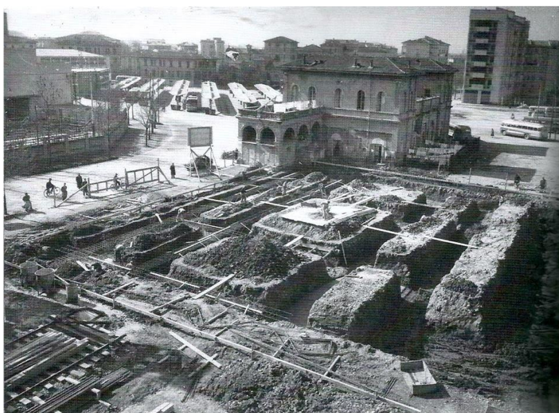
1953: le fondamenta dell'attuale sede dell'Istituto

Dal 2010 l'Istituto Tecnico Commerciale -I.T.C. "J. Barozzi" ha recepito la Riforma degli Istituti Tecnici ed è diventato un Istituto Tecnico Economico - I.T.E., attivando il nuovo indirizzo Amministrazione Finanza e Marketing -AFM con le relative articolazioni: RIM - Relazioni Internazionali per il Marketing e SIA - Sistemi Informativi Aziendali.