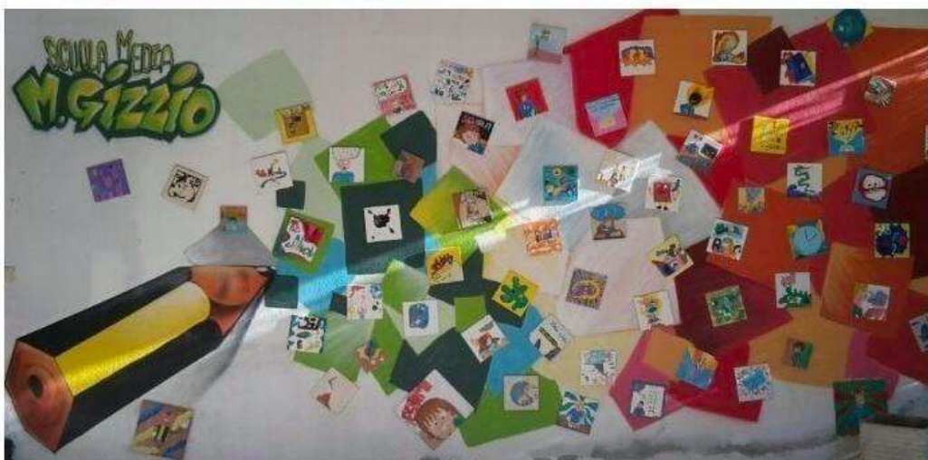
Ingresso della scuola con lavori dei ragazzi

All'esterno è presente un grande cortile allestito con giochi per i bimbi della scuola dell'infanzia e panche e tavole ombreggiate utilizzate sia dagli alunni della scuola dell'infanzia, sia da quelli della scuola secondaria.