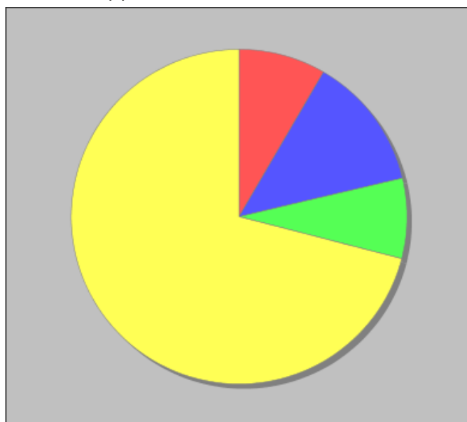
Distribuzione dei docenti a T.I. per anzianità nel ruolo di appartenenza (riferita all'ultimo ruolo)